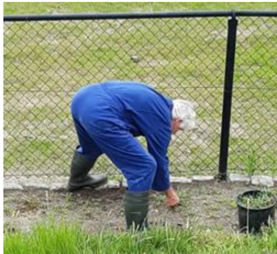
Werken aan een bloemrijkere molenbelt met meer biodiversiteit

Laatste stukje tegenover de invaart van de molen is nu ook ingeplant zodat de entree van het Molenerf helemaal af is! Dit dankzij een goede samenwerking tussen Molenstichting "De Hoop Sprundel", de gemeente Rucphen en een betrokken buurtbewoner die het inplanten van de ongeveer 120 vaste plantjes, passend bij het reeds bestaande assortiment, voor zijn rekening heeft genomen.