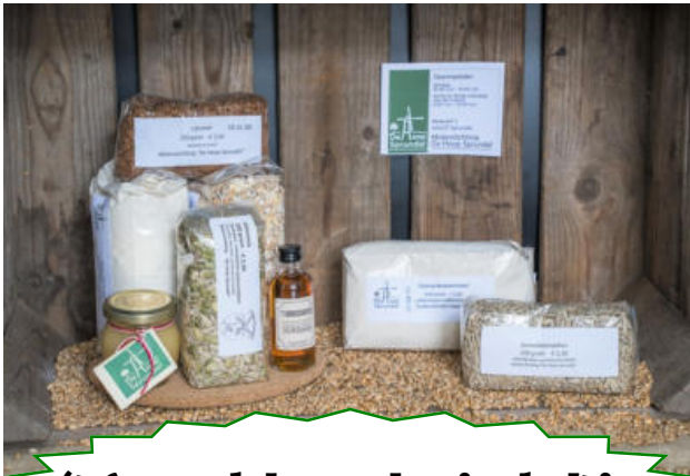
't Sprundels meulewienkeltje

Door Sprundelse meelproducten te kopen van onze molen draagt u bij tot het in stand houden van dit ruim 180 jaar oude Sprundelse beeldbepalende Rijksmonument op het Molenerf.